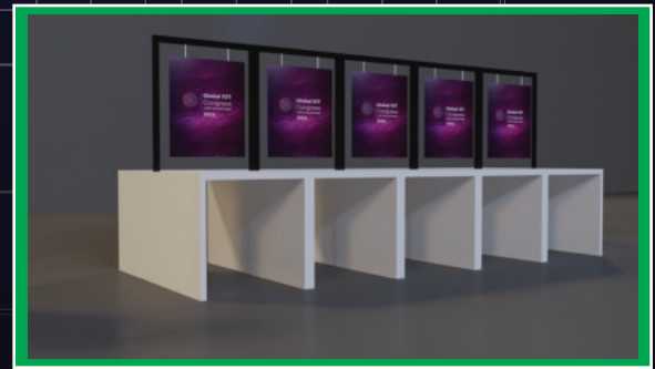
(١ × ١ متر لكل وحدة)