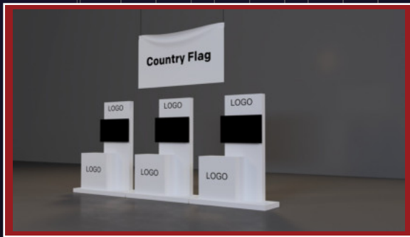
(٣ × ٢ متر)