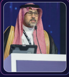
المهندس/ أنس صالح الريمي نائب المحافظ للتقنية والحلول هيئة الحكومة الرقمية